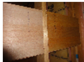
フィニッシュ釘にての取り付け例

強度について 例)手すりの場合は下地の硬さと手すり金具のビスの強度にて決まります。 (参考) 12mm合板下地に手すり金具を取り付けた場合、1箇所約86kg